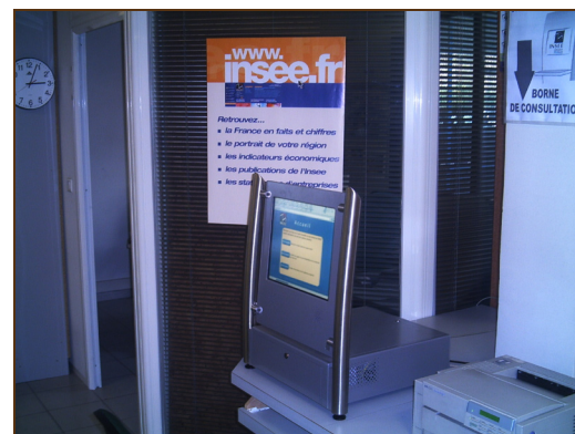
Borne tactile Insee